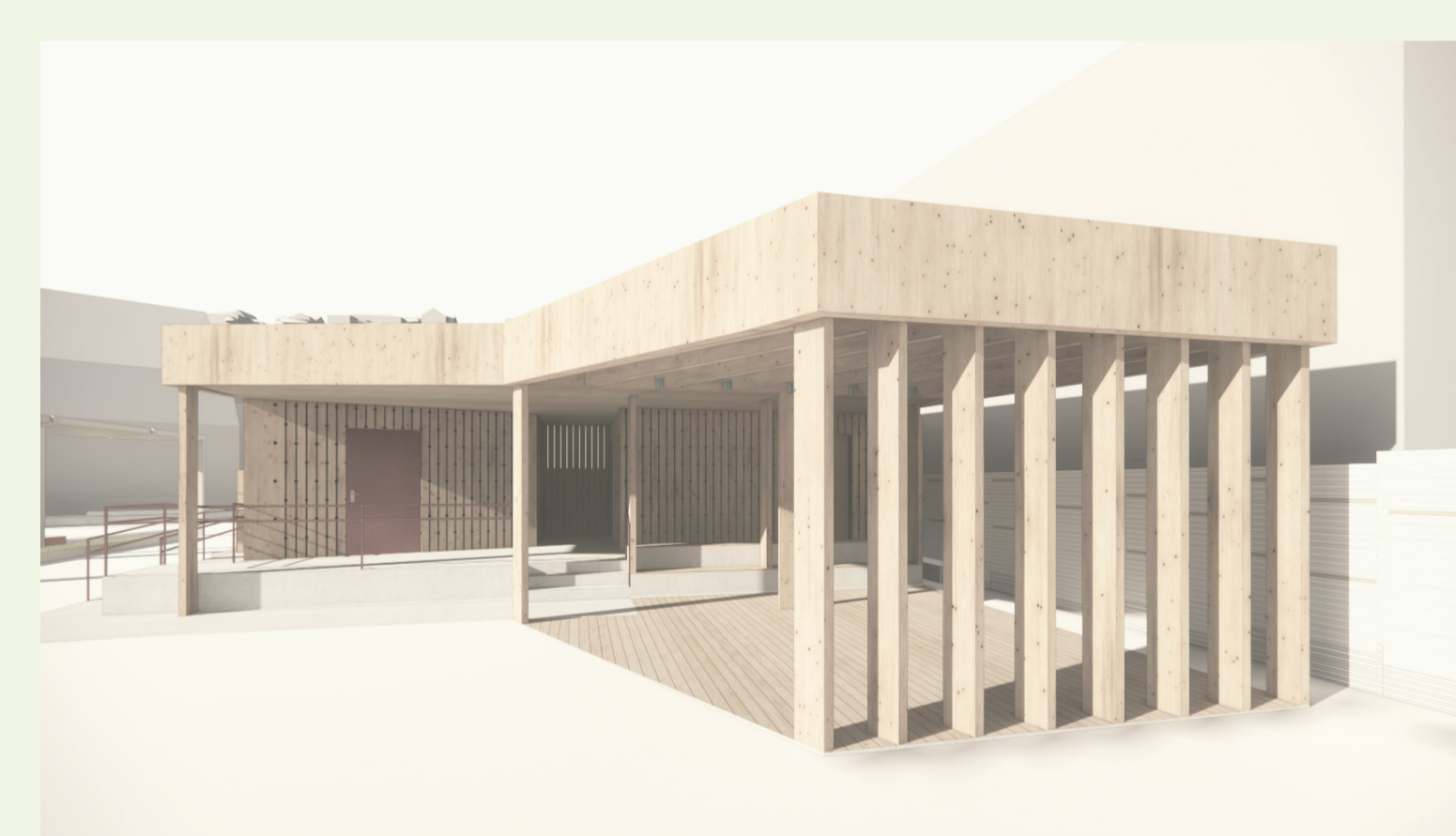
Servicebygg med toalett og dusj