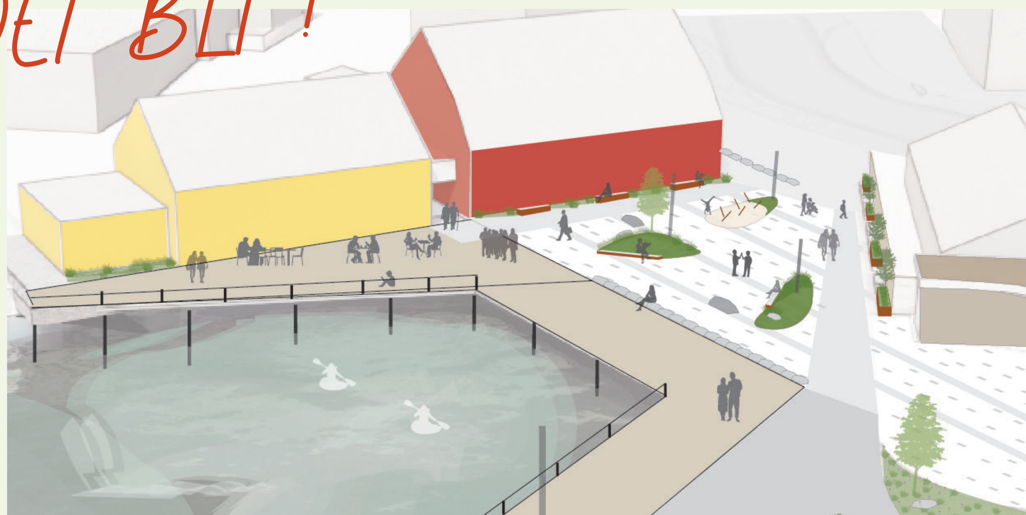
«Museumsplassen» med beplantning sitteplasser og ny kaifront

Byggherre er Salangen kommune. Planlagt byggestart 2023.