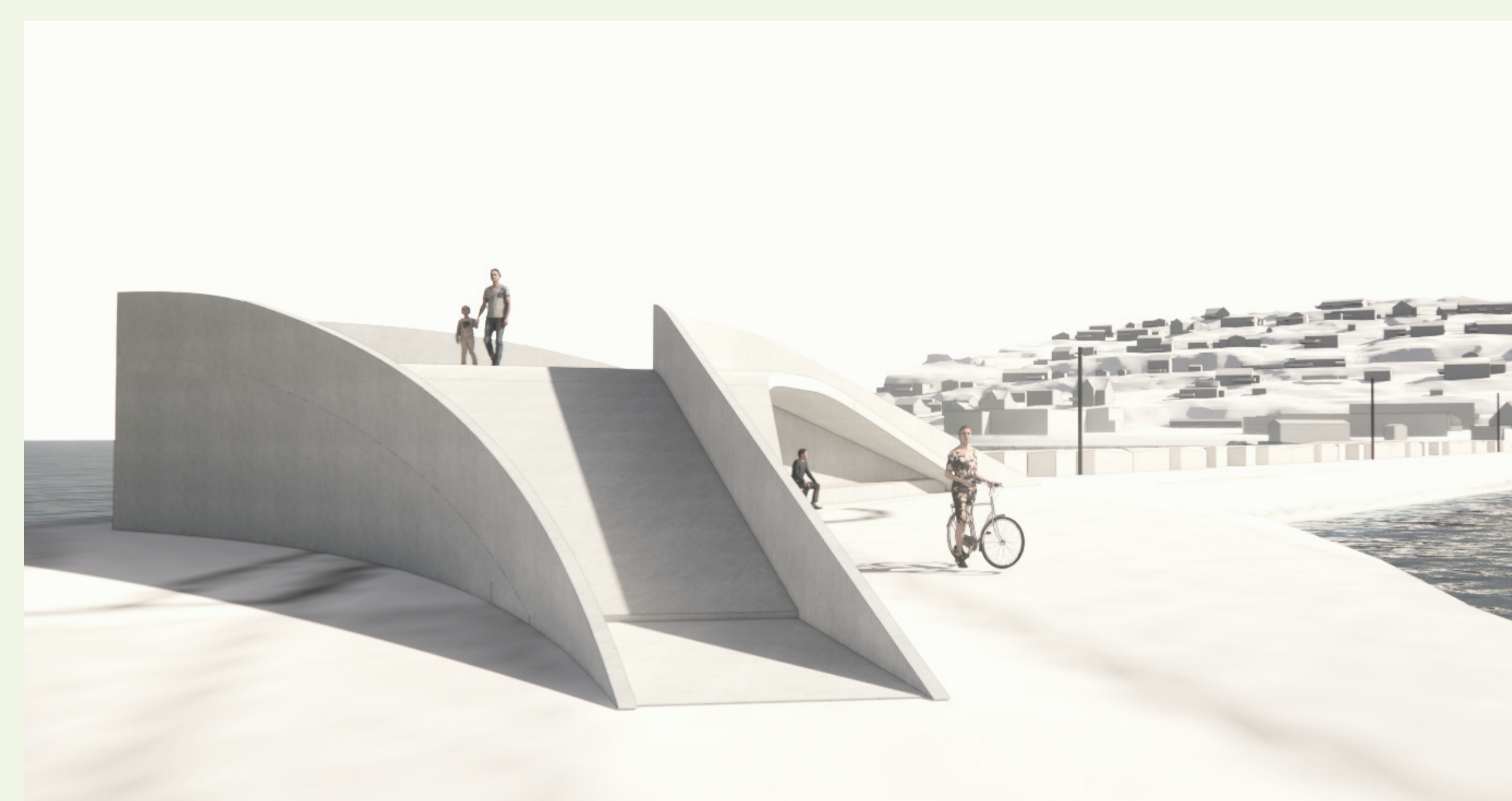
"Gapahuken" med utsiktspunkt fra taket