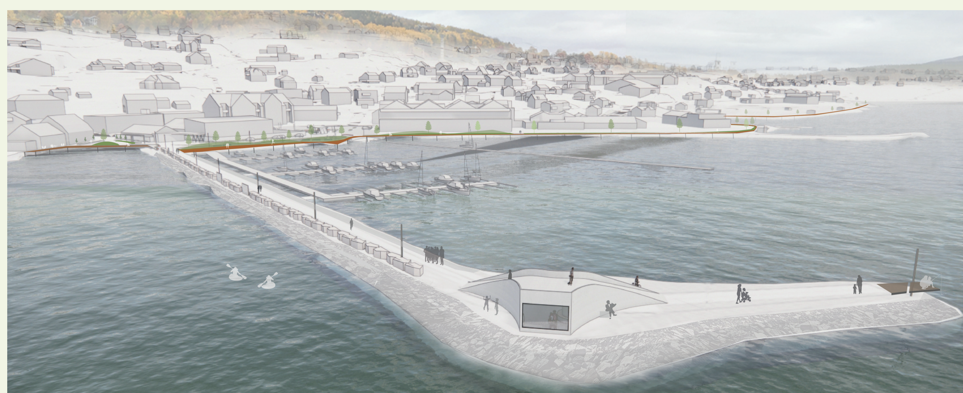
Oppgradert molo med belysning, benker, fiskeplass og "gapahuken"